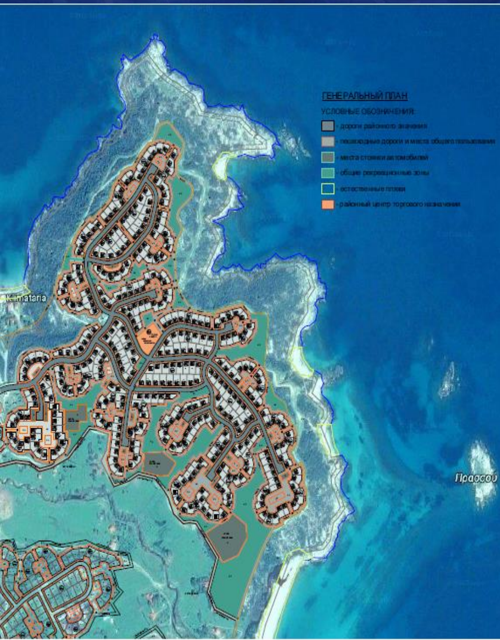
СХЕМА ФУНКЦИОНАЛЬНОГО ЗОНИРОВАНИЯ ТЕРРИТОРИИ